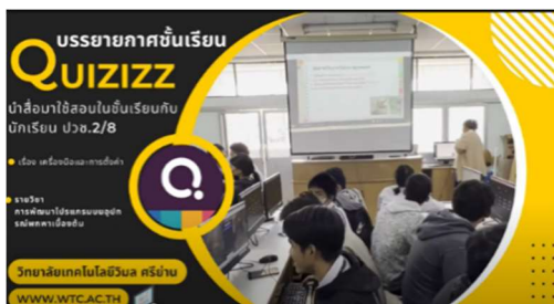
ภาพที่ 1 บรรยากาศชั้นเรียน