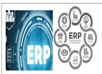
ภาพที่ 1 ระบบ ERP

ระบบ ERP เป็นระบบสารสนเทศที่มีระบบการทำงานเชื่อมต่อฝ่ายต่าง ๆ ขององค์กรให้ทำงานร่วมกันภายใต้ฐานข้อมูลเดียวกันเชื่อมโยงการทำงานเป็นระบบ เก็บข้อมูลเอกสารในฐานข้อมูลบนคลาวด์เซิร์ฟเวอร์ เป็นนวัตกรรมบริการที่ผู้สอนใช้เป็นสื่อการเรียนรู้ระบบงานบัญชีและระบบงานต่าง ๆ ขององค์กรในรายวิชาโครงการ เพื่อให้ผู้เรียนนำระบบ ERP ไปพัฒนาระบบงานและจัดทำบัญชีธุรกิจกรณีศึกษาได้จริง ตามแนวคิดทฤษฎีเน้นผู้เรียนเป็นศูนย์กลางในการศึกษาเรียนรู้ด้วยตนเอง เป็นการเรียนรู้ผสมผสานวิธีการสอนทันสมัยและเทคนิคการสอนแนวใหม่โดยนำเทคโนโลยีสารสนเทศในการเรียนรู้ ERP มี Workflow ครอบคลุมระบบการทำงานบัญชี จัดซื้อ การขาย คลังสินค้า เอกสารรายงานได้มาตรฐาน กระบวนการทางบัญชีอยู่ในรูปแบบโปรแกรมสำเร็จรูป ใช้งานผ่านช่องทางอินเทอร์เน็ต ระบบรวบรวมข้อมูล เก็บเอกสารจากทุกฝ่ายในฐานข้อมูลเดียวกัน ซึ่งเป็นจุดเด่นของสื่อในการลดการใช้กระดาษ ในการจัดการเรียนรู้ผู้สอนใช้ ERP เป็นทฤษฎีเรื่องระบบงานบัญชีผ่านการสาธิตวิธีการปฏิบัติงานบนที่วีดิทัศน์ประยุกต์ใช้คู่มือการปฏิบัติเลือกโปรแกรมสำเร็จรูปบน ERP โดยแบ่ง 2 กลุ่ม ธุรกิจบริการ และธุรกิจการค้า ศึกษาระบบปฏิบัติงานธุรกิจ เช่น จัดตั้งค่าธุรกิจ เริ่มต้น สร้างข้อมูลสินค้า ผู้ซื้อขาย สร้างเอกสาร ตั้งราคาทุน-ขาย สต็อก กำไรขาดทุน ป้อนข้อมูลซื้อขายธุรกิจบนโปรแกรมสำเร็จรูปที่เลือกแต่ละกลุ่ม พบว่าผู้เรียนมีความรู้เข้าใจระบบ ERP เกิดทักษะปฏิบัติงานในการพัฒนาธุรกิจกรณีศึกษาร้านอาหาร KINDEE BITRO และร้านค้าสุรนันทาผ่านระบบ ERP โดยทำการวัดความรู้ผู้เรียนด้วย Quizizz เรื่องการปฏิบัติงานบัญชีบนระบบ ERP ผู้เรียนผ่านร้อยละ 80 ทุกคน