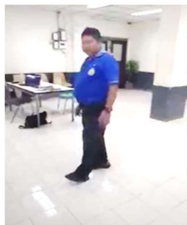
ภาพที่ 2 ตัวอย่างสื่อการสอน