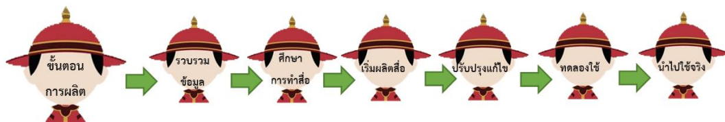
ภาพที่ 1 ขั้นตอนการผลิตสื่อ กรุงศรีอยุธยา แกลอรี