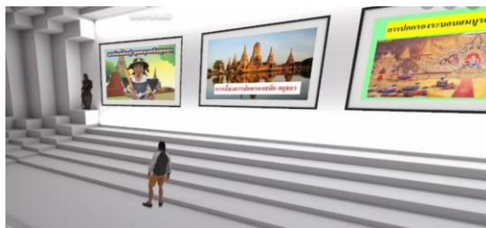
ภาพที่ 2 ตัวอย่างสื่อ กรุงศรีอยุธยา แกลอรี