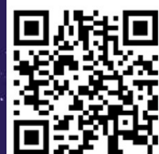
ภาพที่ 1 ตัวอย่างคลิปนำเสนอโครงการงาน