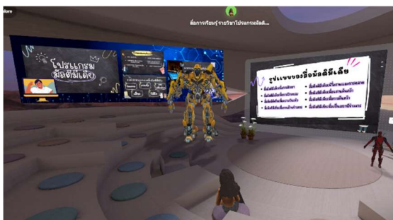
ภาพที่ 1 บรรยากาศในการเรียน META