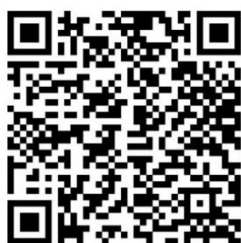
ภาพที่ 1 ขั้นตอนการสร้างสื่อ

ผู้จัดทำ มีเครื่องมือแสดงให้เห็นว่าสื่อการสอนมีประสิทธิภาพใช้ได้จริง ซึ่งมีประโยชน์กับผู้เรียนที่จะสามารถเรียนรู้ซ้ำ ๆ เพิ่มความเข้าใจอย่างยั่งยืนได้ทุกที่ทุกเวลา และสามารถฝึกจัดทำงบทดลองหลังปรับปรุง (บช.อาชีพอิสระ) ด้วยตนเองได้อย่างถูกต้อง ผู้จัดทำมีแนวคิดต่อยอดความสมบูรณ์ของสื่อนี้ โดยแทรกแบบทดสอบให้กับผู้เรียนได้ฝึกปฏิบัติพร้อมทั้งแสดงผลคะแนนความถูกต้องให้กับผู้เรียน เพิ่มช่องทางการเรียนรู้ให้มากขึ้นและจะพัฒนาในรายวิชาอื่นต่อไป ผู้เรียนเกิดความพึงพอใจต่อการจัดการเรียนการสอนด้วยสื่อการสอนนี้ อยู่ในระดับมากที่สุด ( \bar{x} = 4.88 )