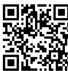
ภาพที่ 2 การทำงานของสื่อ