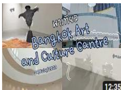
ภาพที่ 1 คลิป vlog พาเที่ยวหอศิลป์วัฒนธรรมแห่งกรุงเทพฯ

การทำวิดีโอแนะนำสถานที่ท่องเที่ยวในกรุงเทพฯ และออฟไลน์ลง YouTube ทำให้ผู้เข้ามาศึกษาสามารถเข้าใจ และสามารถประกอบอาชีพเสริมได้จากการทำคลิป Vlog เพื่อหารายได้ต่อไปได้