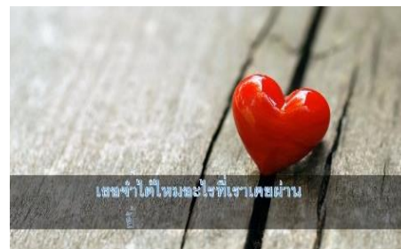
ภาพที่ 2 คาราโอเกะที่สามารถนำมาร้องเพลงได้