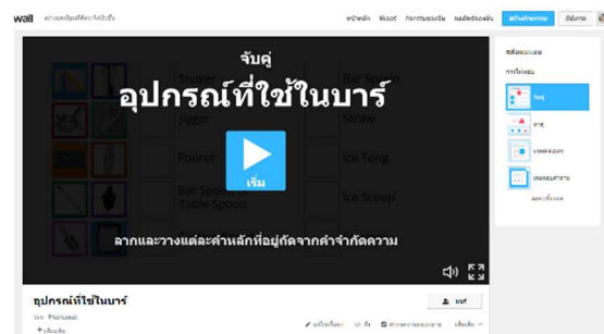
ภาพที่ 2 หน้าเกมส์ Wordwall