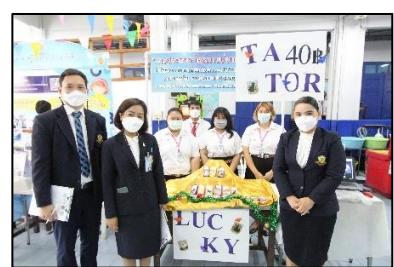
ภาพที่ 1 หน้าจอเว็บไซต์ Lucky Tarot ภาพที่ 2 Link Website ภาพที่ 3 ออกร้านขายสินค้า