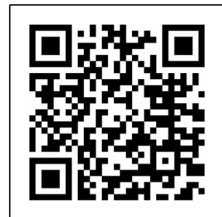
ภาพที่ 1 Link Website

ซึ่งทีมพัฒนาได้เห็นโอกาสสร้างช่องทางรายได้ ให้มีช่องทางสำหรับขายรูปภาพผ่านทางเว็บไซต์จึงมีความคิดที่จะสร้างเว็บไซต์ขายรูปภาพ เพื่อคือ 1) ส่งเสริมและเพิ่มช่องทางในการสร้างรายได้ของช่างภาพ และสามารถสร้างรายได้ให้กับทีมพัฒนาได้ในขณะที่ยังศึกษาอยู่และสามารถต่อยกได้ในอนาคต 2) เพื่อสร้างเว็บไซต์ที่ออกแบบมาเพื่อขายภาพที่เป็นไฟล์อิเล็กทรอนิกส์โดยเฉพาะ 3) เพื่ออำนวยความสะดวกในการสร้างช่องทางหารายได้และการขาย จึงเกิดเป็นเว็บไซต์การพัฒนาเว็บไซต์ขายรูปภาพด้วย Wix ขึ้นมา โดยขั้นตอนในการดำเนินการนั้น ภาพที่อยู่บนเว็บไซต์ทางทีมพัฒนาได้ถ่ายเองโดยมีการใส่ลายน้ำไว้บนภาพก่อนการซื้อขาย เมื่อมีลูกค้าสนใจ ทำการชำระเงินเรียบร้อยแล้ว ภาพนั้นจะถูกส่งไปอีเมลของผู้ซื้อทันที ทำให้เกิดความสะดวกในการดำเนินการกับเว็บไซต์ดังกล่าว และทำให้เกิดความประทับใจได้นอกเหนือจากการชื่นชอบและสนับสนุนผลงานของทีมพัฒนา