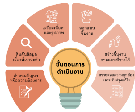
ภาพที่ 1 ขั้นตอนการดำเนินงาน

ในการผลิตสื่อสร้างสรรค์ครั้งนี้ คณะผู้จัดทำใช้แนวคิดทฤษฎีในเรื่องขององค์ประกอบศิลป์สำหรับงานคอมพิวเตอร์ การผลิตสื่อสิ่งพิมพ์ (Infographic) การผลิตสื่อสร้างสรรค์เป็นคลิปวิดีโอ และนำไปเผยแพร่ผ่านช่องทาง Youtube ฯลฯ