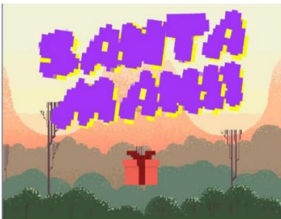
ภาพที่ 1 หน้าเมนูเกม

การทำสื่อมัลติมีเดียเกมส์ “Santa Man” สามารถนำไปประกอบอาชีพเสริมได้ โดยการอัปโหลดดเกมลงเว็บ Scratch ในการมีรายได้จากการลงสื่อในรูปแบบออนไลน์