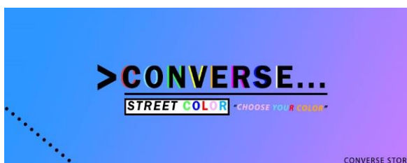
ภาพที่ 1 รูปโลโก้ที่เสร็จแล้ว

สามารถประกอบอาชีพได้และนำไปต่อยอดในอนาคตต่อตนเองและครอบครัวหรือสามารถ นำไปใช้กิจกรรมต่าง ๆ ได้